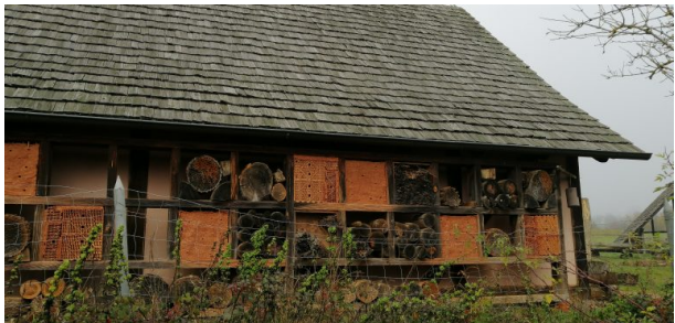
Insektenhotel im Keltengarten Steinbach (Dr. Hans-Günther Clev , 2020)