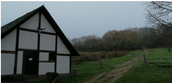
Keltengarten in Steinbach am Donnersberg (Dr. Hans-Günther Clev , 2020)

Dana Taylor am 03.08.2021 um 13:19:40Uhr