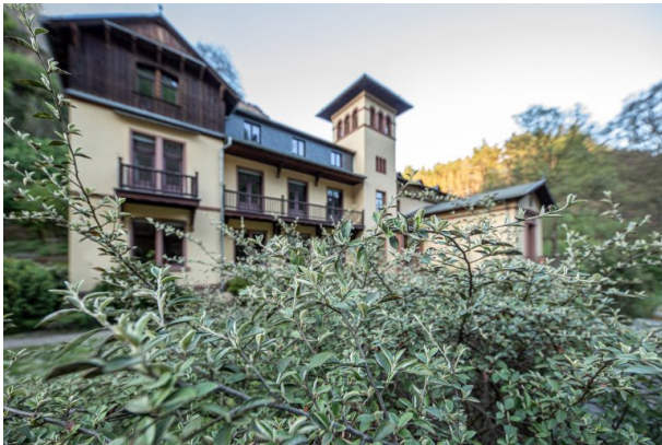
Blick auf die Frontseite der Villa Denis (Harald Kröher, 2020)