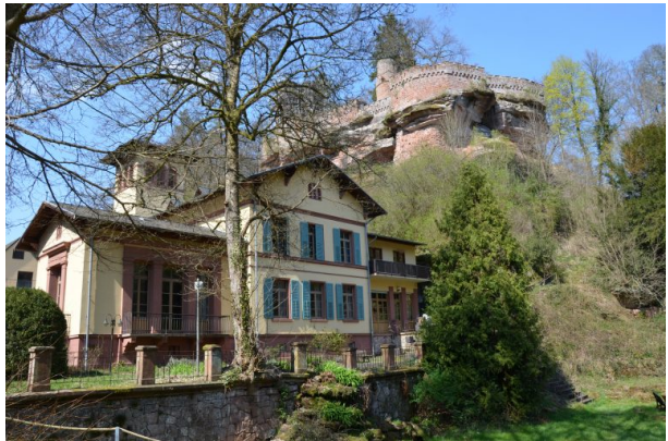
Herrenhaus "Villa Denis" im klassizistischen Stil (Dr. Hans-Günther Clev , 2020)