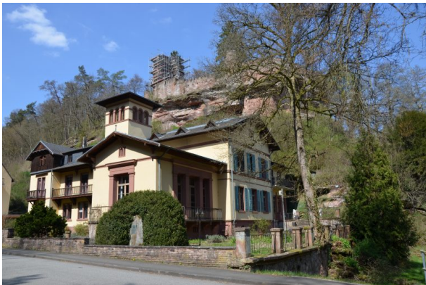
Villa Denis im Vordergrund und im Hintergrund die Burgruine Diemerstein (Dr. Hans-Günther Clev , 2020)