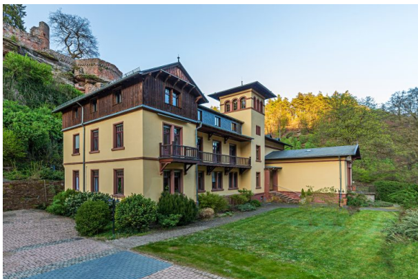
Villa Denis in Diemerstein (Harald Kröher, 2020)

Dana Taylor am 03.08.2021 um 13:05:12Uhr