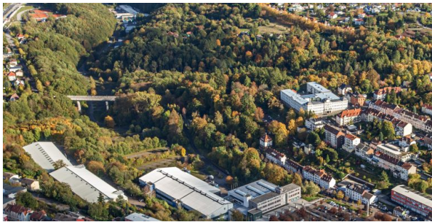
Luftaufnahme des Neufferparks - im Vordergrund "Neuffer am Park" (Harald Kröher, 2019)

Dana Taylor am 05.10.2021 um 16:27:34Uhr