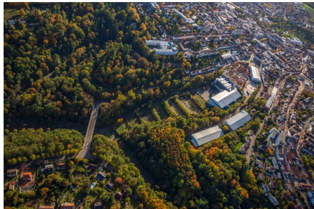
Luftaufnahme des Neufferparks (Harald Kröher, 2019)