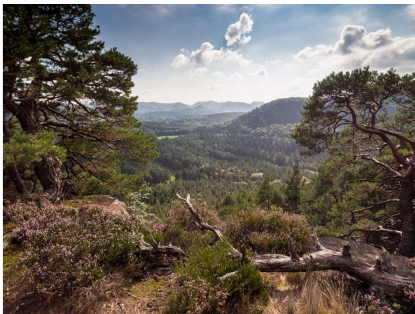
Blick vom Schlüsselfelsen über den südlichen Wasgau (Torben Fruth, 2014)

Dana Taylor am 04.11.2021 um 12:22:49Uhr