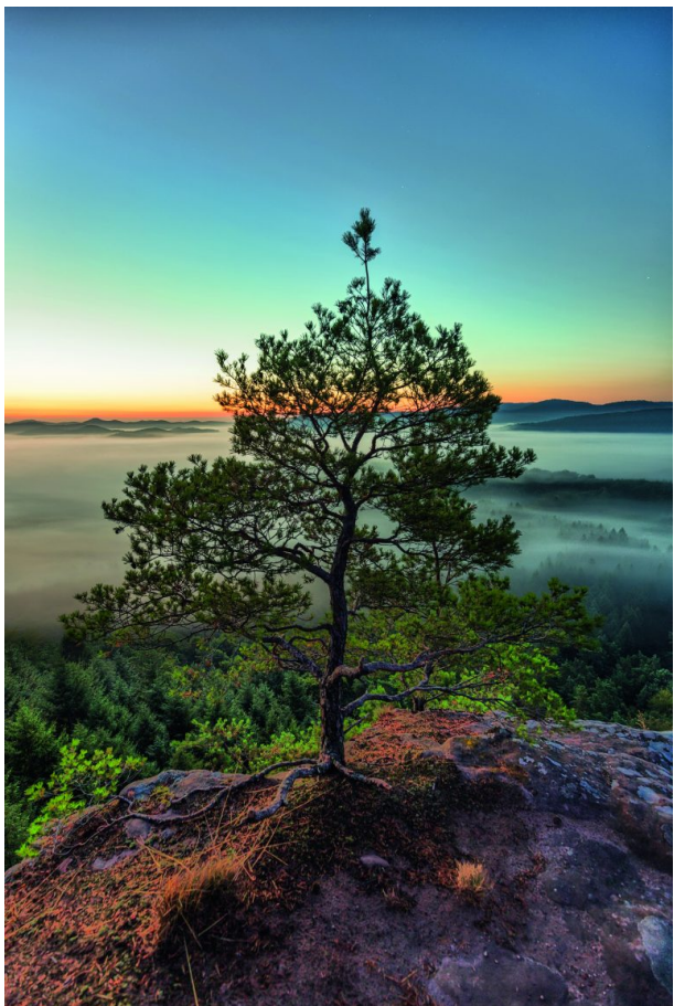
Baum auf dem Schlüsselfelsen (Christian Fernandez-Gamio , 2016)