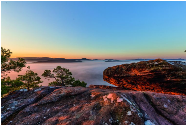
Sonnenaufgang über dem Schlüsselfelsen (Christian Fernandez-Gamio , 2016)