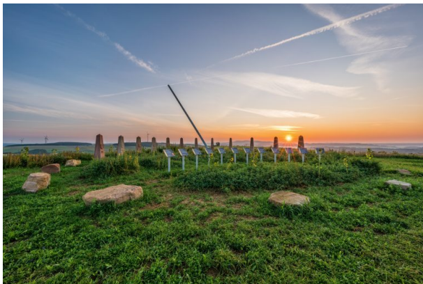
Sonnenuhr auf dem Reiserberg bei Schallodenbach (Martin Koch, 2021)