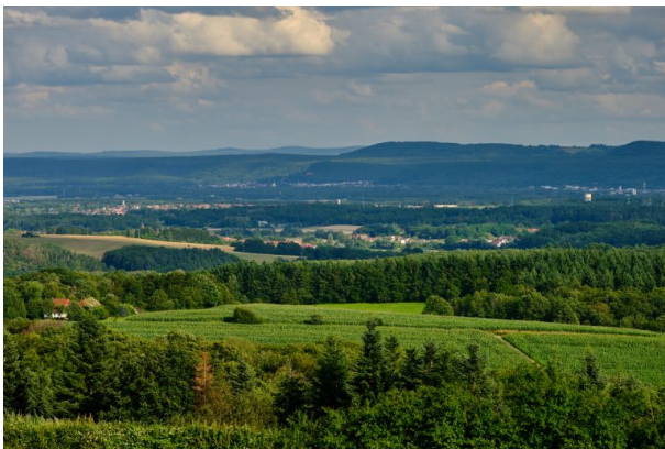
Blick von der Aussichtsplattform auf der Reuschbacher Höhe