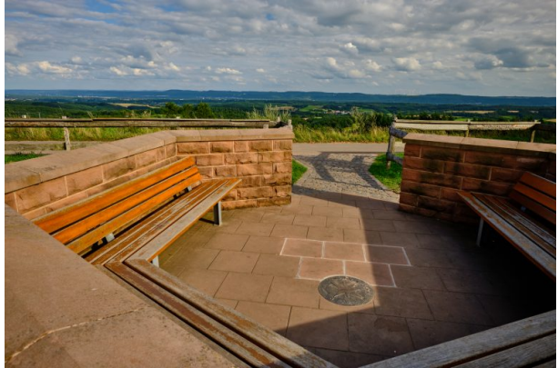
Aussichtsplattform auf der Reuschbacher Höhe (Torben Fruth, 2021)