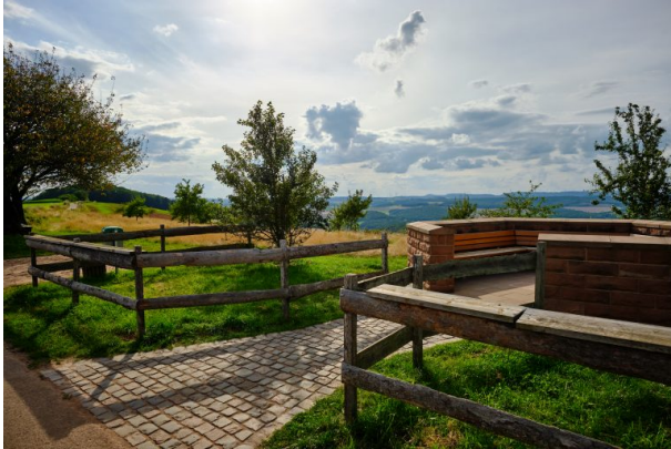
Aussichtsplattform auf der Reuschbacher Höhe (Torben Fruth, 2021)

Dana Taylor am 24.03.2022 um 15:50:02Uhr