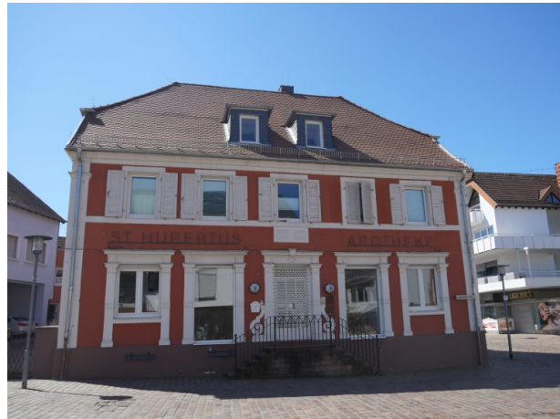
Frontansicht der klassizistischen St. Hubertus-Apotheke in Ramstein