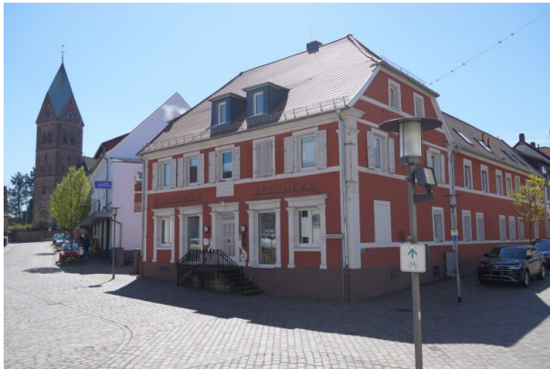
Die alte St. Hubertus Apotheke in Ramstein (Dana Taylor, 2022)