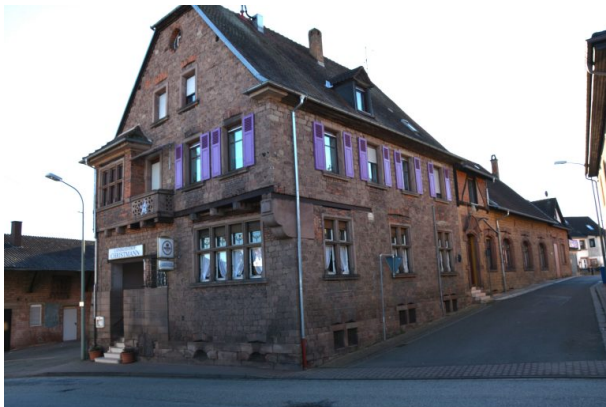
Gebäude aus nordwestlicher Richtung (Arne Schwöbel, 2020)

Philipp Markgraf am 22.06.2022 um 10:05:52Uhr