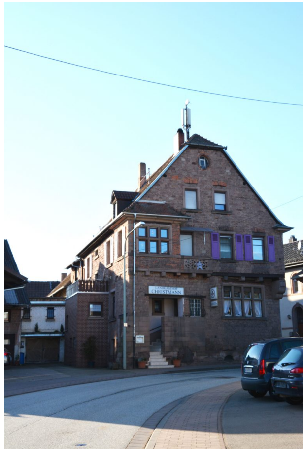
Frontalansicht auf das Gasthaus (Arne Schwöbel, 2020)