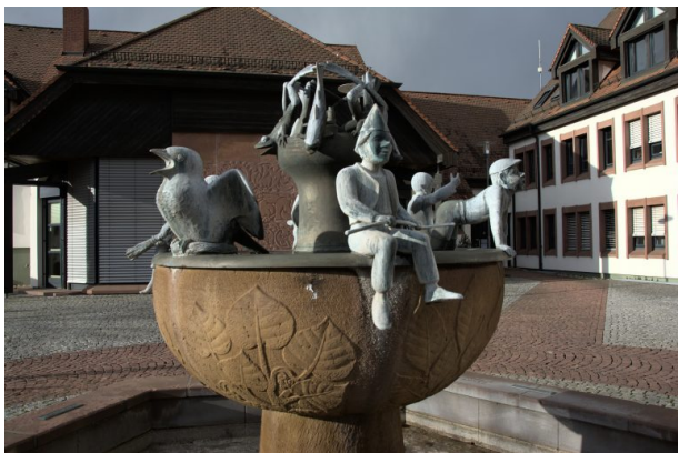
Nahaufnahme der verschiedenen Bronzefiguren auf den Brunnenbecken (Sonja Kasprick, 2020)