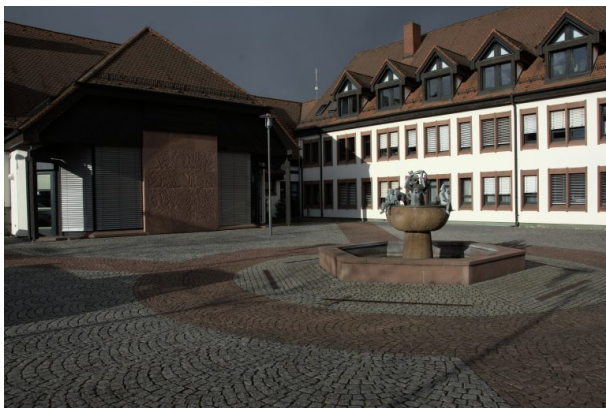
Brunnen auf dem Zentrum des Platzes, Verwaltungsgebäude im Hintergrund (Sonja Kasprick, 2020)

Philipp Markgraf am 22.06.2022 um 12:03:25Uhr