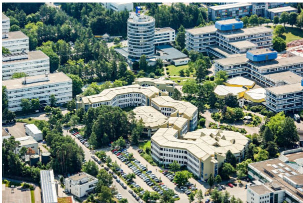
Campus der Technischen Universität Kaiserslautern, Rechenzentrum und Zentralbibliothek im Zentrum. Im Hintergrund das runde Verwaltungsgebäude.

Philipp Markgraf am 13.07.2022 um 13:26:18Uhr