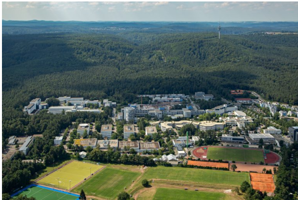
Uni-Campus aus nördlicher Richtung. Guter Blick auf Vielseitigkeit der Sportfläche und die Lage des Campus mitten im Pfälzer Wald sticht hervor. (Harald Kröher, 2018)