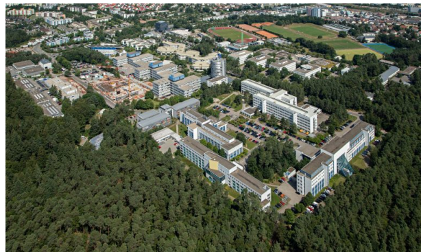
Campus aus östlicher Perspektive. Im Vordergrund die Gebäude der Fachbereiche Chemie und Biologie. Im Hintergrund ist das Sportareal und Teile der Uni-Wohnstadt zu sehen. (Harald Kröher, 2018)