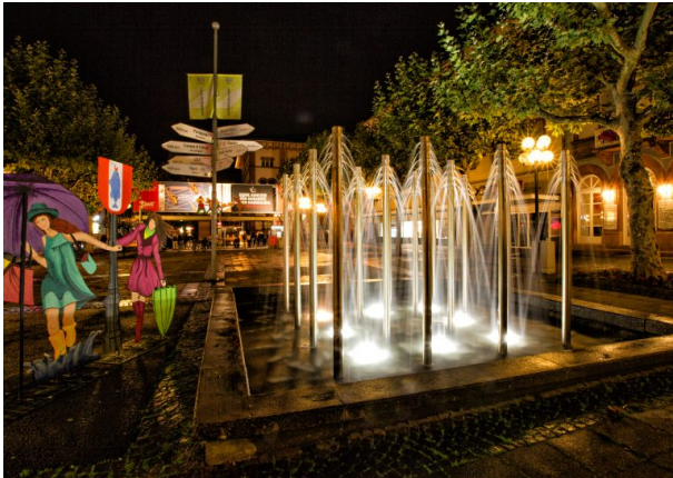
Schillerplatz vor der Umgestaltung 2020 (Harald Kröher, 2015)

Philipp Markgraf am 06.12.2023 um 08:06:16Uhr