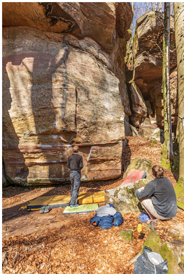
Kletterer in Aktion (Harald Kröher, 2022)