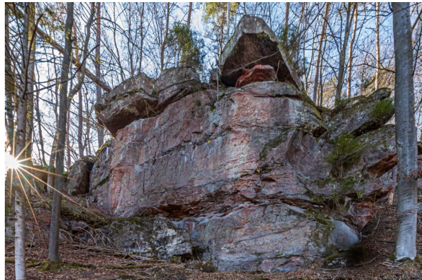
Blick auf die Felswand (Harald Kröher, 2022)