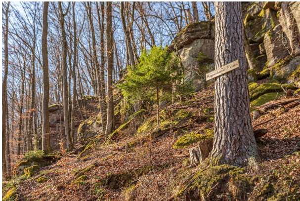
Beschilderung des Felsen (Harald Kröher, 2022)