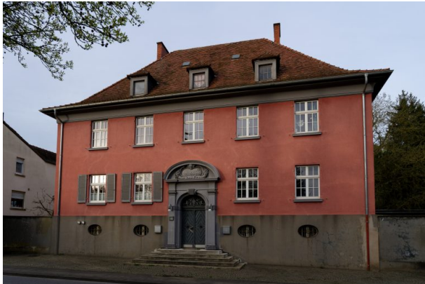
Ehemaliges Verwaltungsgebäude der Basalt-AG (Markus Eberl, 2024)

Philipp Markgraf am 26.04.2024 um 12:40:31Uhr