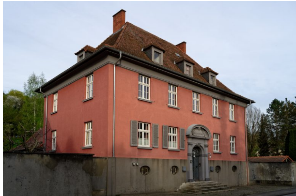
Ehemaliges Verwaltungsgebäude der Basalt-AG (Markus Eberl, 2024)