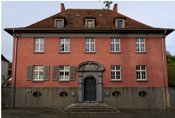
Ehemaliges Verwaltungsgebäude der Basalt-AG (Markus Eberl, 2024)