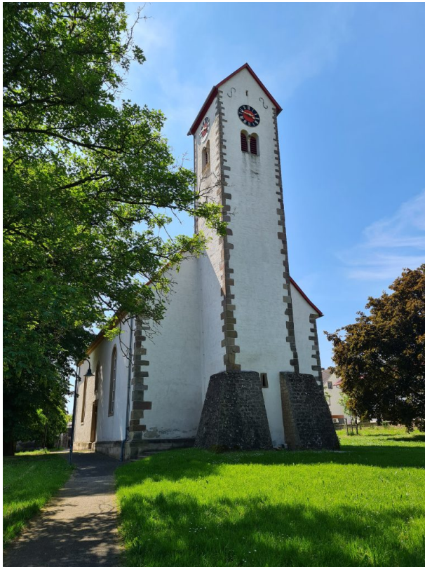
Blick auf den Kirchturm aus östlicher Richtung (Alena Frieß, 2023)