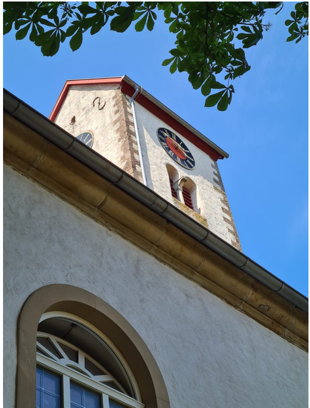
Detailaufnahme des Glockenturms (Alena Frieß, 2023)