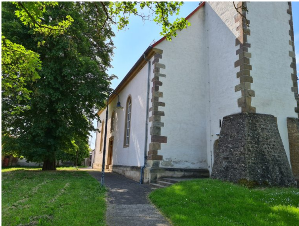
Weiterer Eingang auf südlicher Seite (Alena Frieß, 2023)