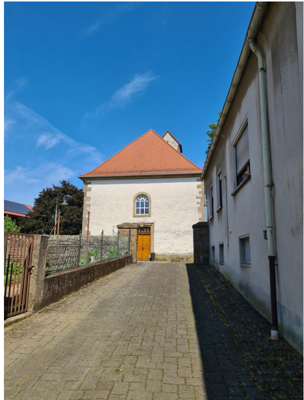
Haupteingang der Kirche auf westlicher Seite (Alena Frieß, 2023)