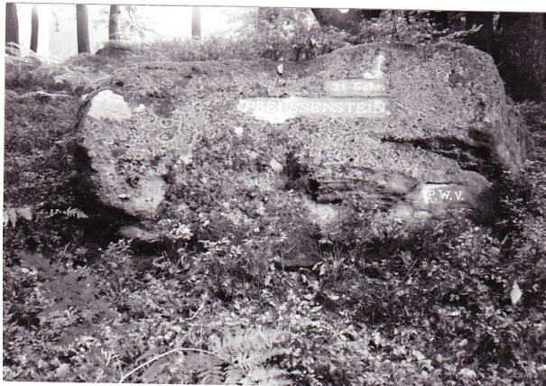
Ritterstein mit der Inschrift "21 Schr. Preussenstein" (Erhard Rohe, 1993)