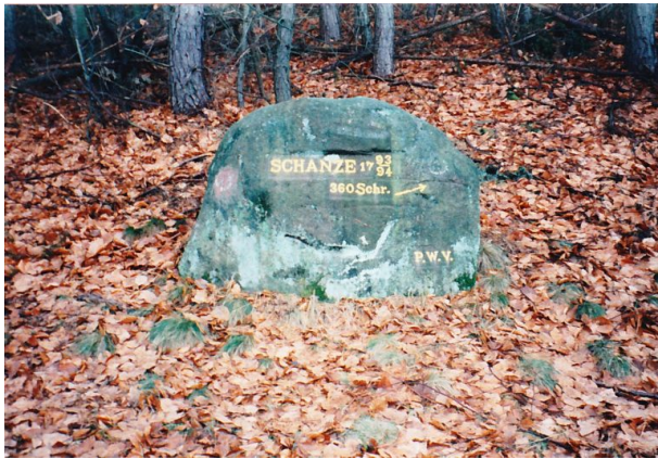
Ritterstein mit der Inschrift "Schanze 1793/94 360 Schr." (Erhard Rohe, 1998)