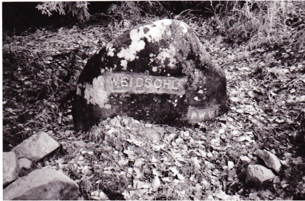
Ritterstein mit der Inschrift "Weidsohl" (Erhard Rohe, 1993)