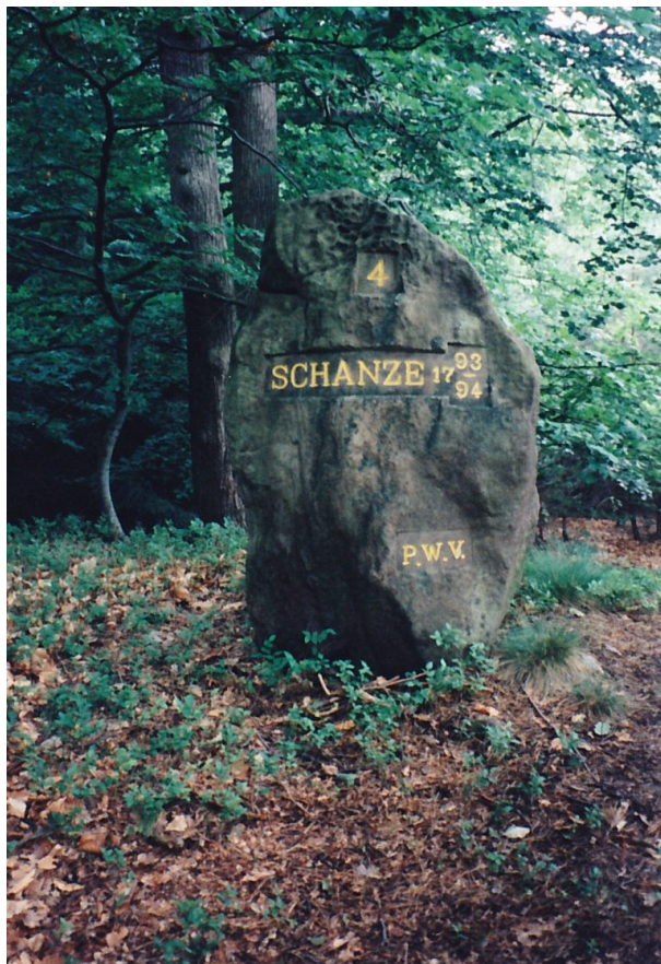
Ritterstein mit der Inschrift "Schanze 1793/94". Er ist mit der Nummer 4 markiert. (Erhard Rohe, 1997)