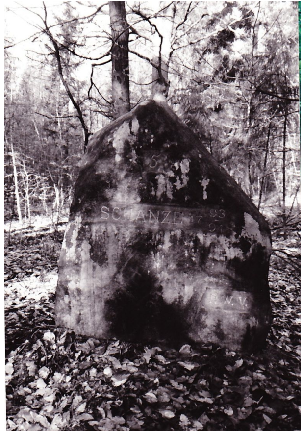
Ritterstein mit der Inschrift "Schanze 1793/94". Er ist mit der Nummer 5 markiert. (Erhard Rohe, 1997) (Erhard Rohe, 1993)