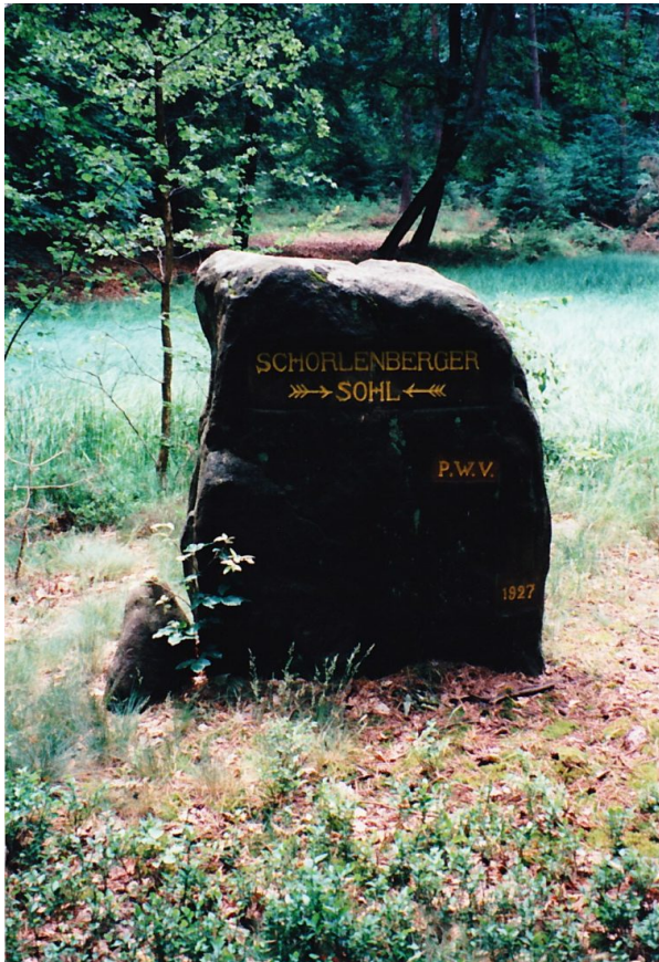
Ritterstein mit der Inschrift "Schorlenberger Sohl" (Erhard Rohe, 1997)