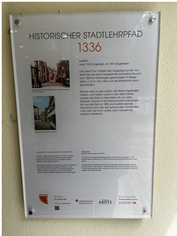
Informationstafel des Stadtlehrpfads (Philipp Markgraf, 2023)