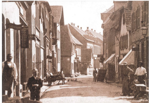
Historischer Einblick in die Kerststraße (Unbekannt, o.J.)