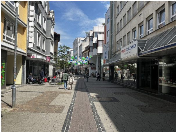
Blick in die Kerststraße vom Union-Kino. (Philipp Markgraf, 2023)