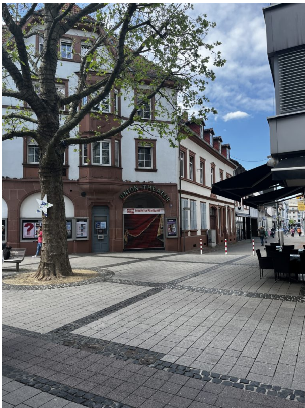
Erweiterter Blick auf das Gebäude (Philipp Markgraf, 2023)