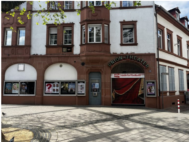
Eingang des Unionkinos (Philipp Markgraf, 2023)