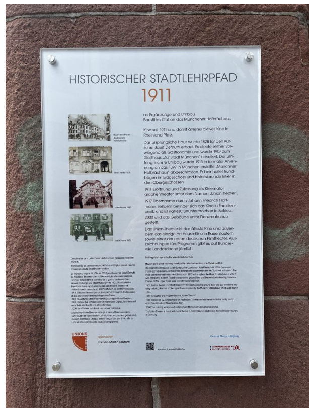
Informationstafel des Stadtlehrpfads (Philipp Markgraf, 2023)