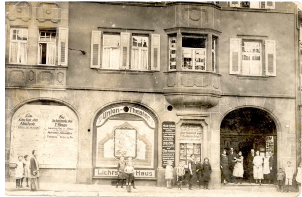
Historische Aufnahme des Kinos (Unbekannt, um 1920)