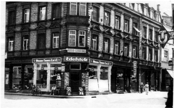
Pirmasenser Straße 1 vor dem Einzug des Café bremer (Unbekannt, um 1917)