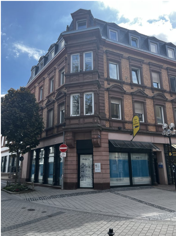
Gebäude der Pirmasenser Straße 1 heute (Philipp Markgraf, 2023)