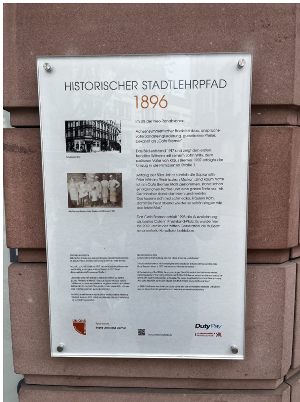
Informationstafel des Stadtlehrpfads (Philipp Markgraf, 2023)