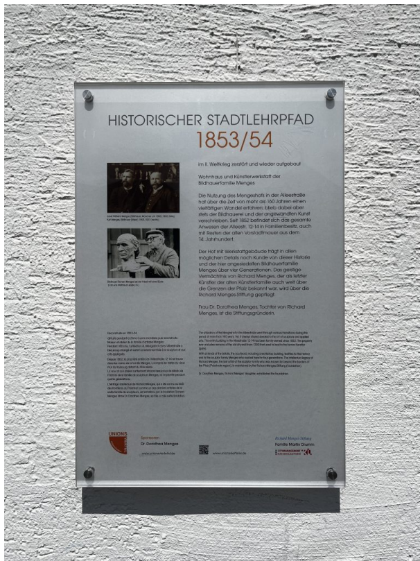
Informationstafel des Stadtlehrpfads (Philipp Markgraf, 2023)