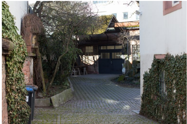
Hof des Anwesens in der Alleestraße 14 (Matthias Quinten, o.J.)