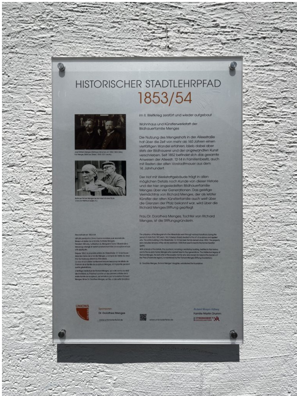
Informationstafel des Stadtlehrpfads (Philipp Markgraf, 2023)