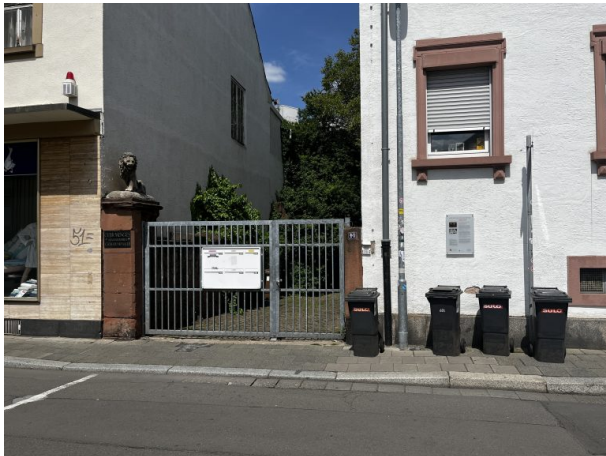
Eingangstor zum Innenhof. Name der Gebr. Menges ist links zu sehen. (Philipp Markgraf, 2023)