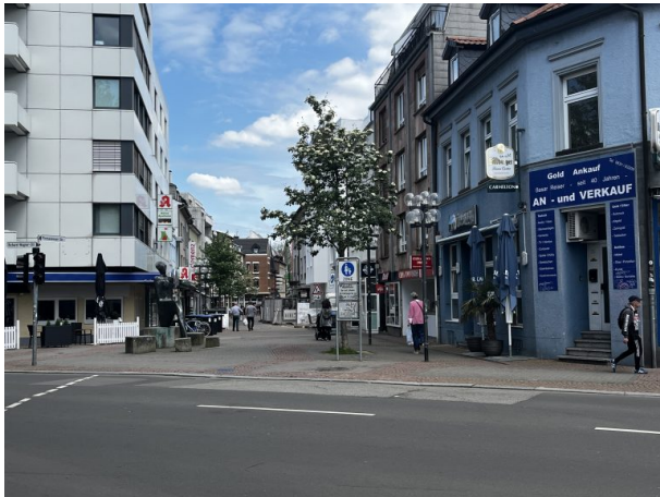
Blick in die Pirmasenser Straße von der Richard-Wagner-Straße (Philipp Markgraf, 2023)