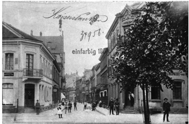
Historische Aufnahme der Pirmasenser Straße (Unbekannt, 1908)