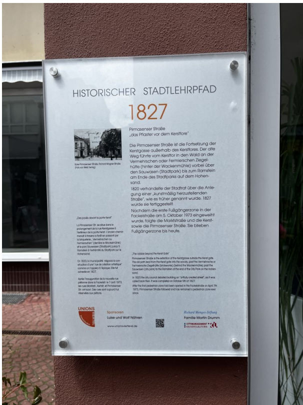
Informationstafel des Stadtlehrpfads (Philipp Markgraf, 2023)