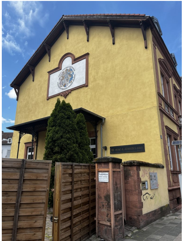
Näherer Blick auf den Eingang des Gebäudes und auf das Wappen (Philipp Markgraf, 2023)