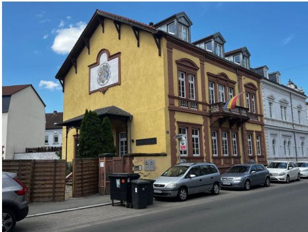
Blick auf das Gebäude aus südlicher Richtung. Haupteingang, sowie Wappen der Verbindung auf der Giebelseite (Philipp Markgraf, 2023)