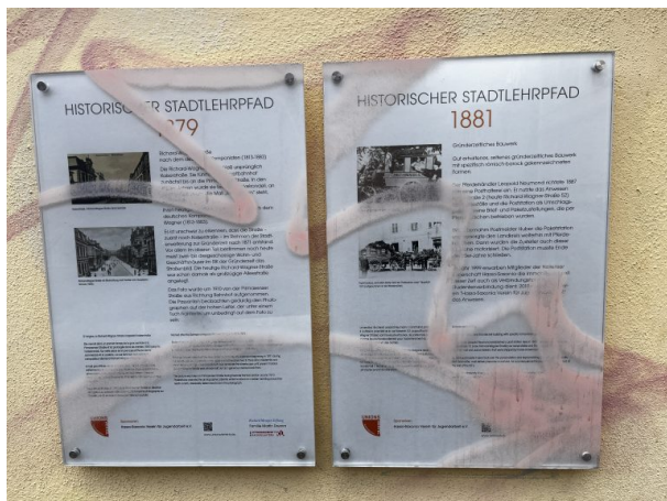
Informationstafel des Stadtlehrpfades (Philipp Markgraf, 2023)