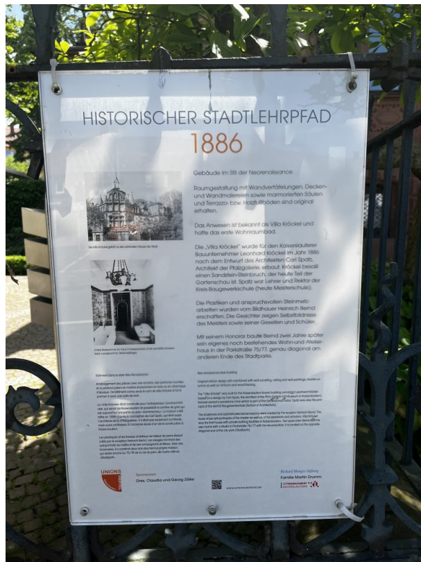
Informationstafel des Stadtlehrpfads (Philipp Markgraf, 2023)