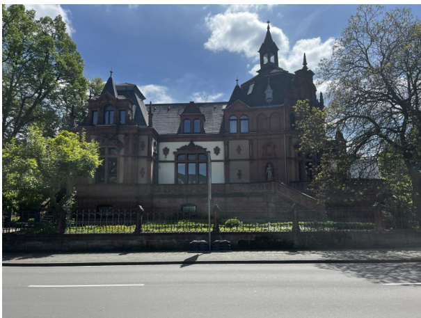
Ansicht von der Pirmasenser Straße (Philipp Markgraf, 2023)