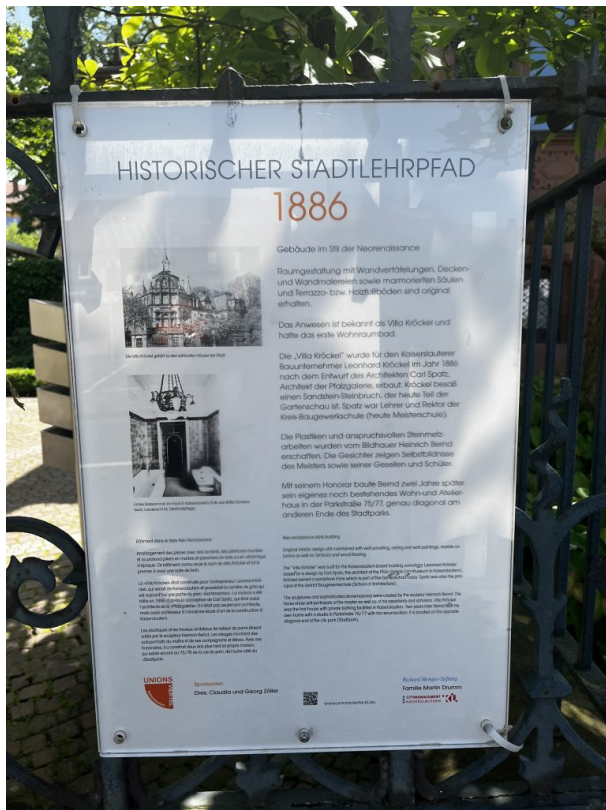
Informationstafel des Stadtlehrpfads (Philipp Markgraf, 2023)