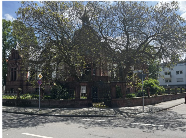
Blick auf die Villa von der Ecke Pirmasenser Straße - Trippstadter Straße (Philipp Markgraf, 2023)