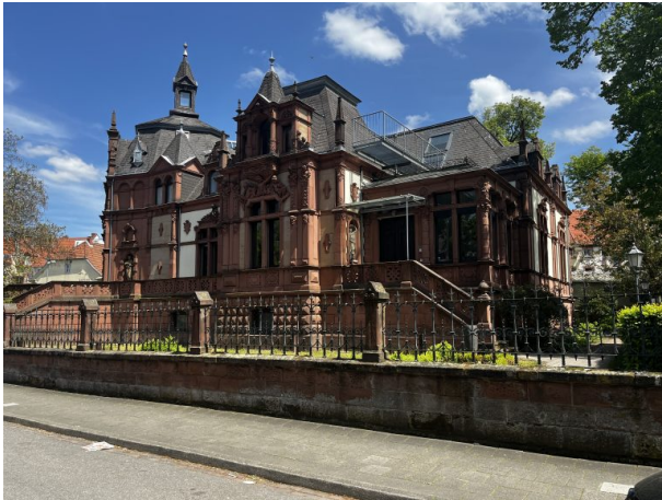
Blick auf das Anwesen aus südlicher Richtung (Philipp Markgraf, 2023)

Philipp Markgraf am 05.05.2023 um 12:14:27Uhr