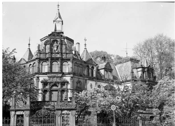
Teil des Gebäudes von der gegenüberliegenden Straßenseite (Unbekannt, o.J.)