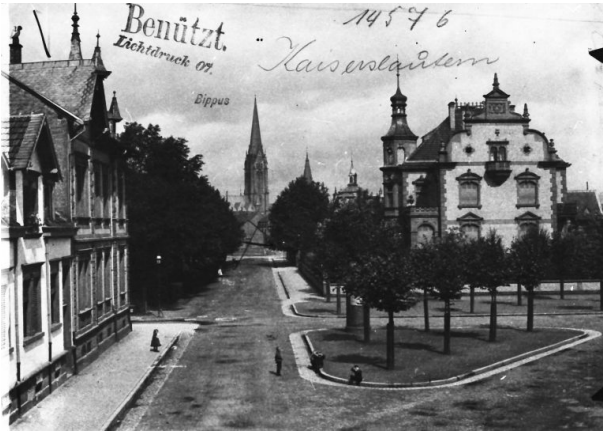
Villa Meilchen auf der rechten Seite. Auf der gegenüberliegenden Straßenseite der Stadtpark (Unbekannt, o.J.)