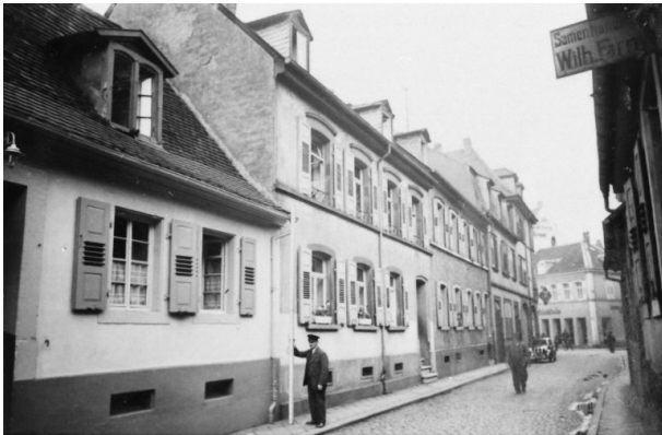
Historische Aufnahme der Rosenstraße (Unbekannt, o.J.)