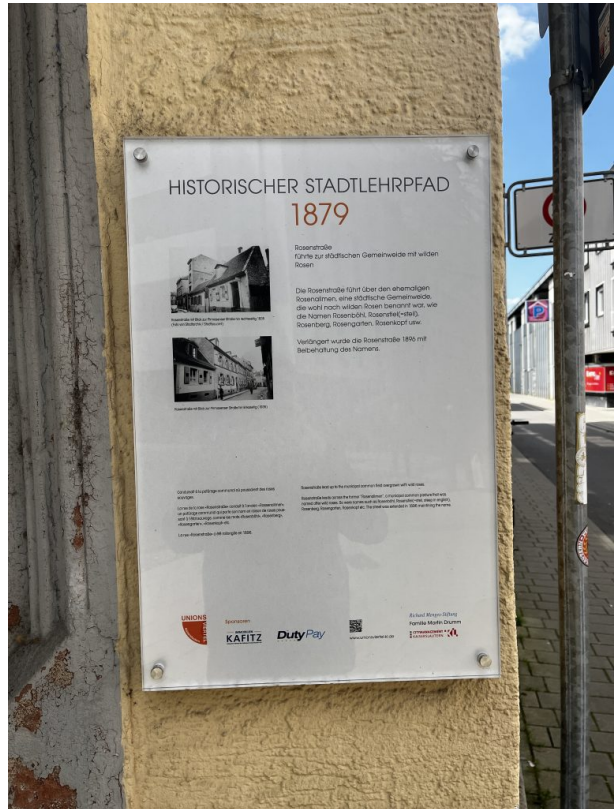
Informationstafel des Stadtlehrpfads (Philipp Markgraf, 2023)