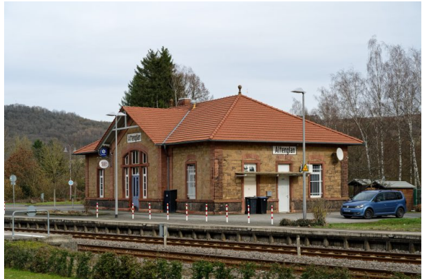
Blick auf das Gebäude aus südlicher Richtung (Markus Eberl, 2024)