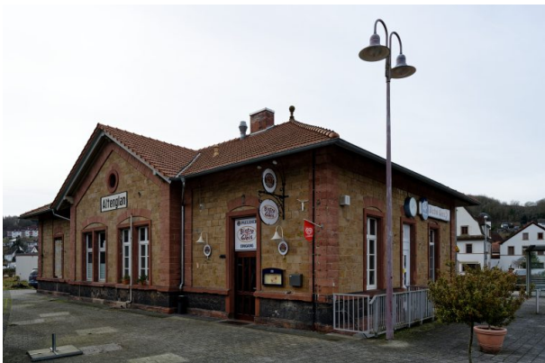
Östlicher Eingang vom Fritz-Wunderlich Weg, ebenfalls Eingang zum Bistro Gleis 3 (Markus Eberl, 2024)