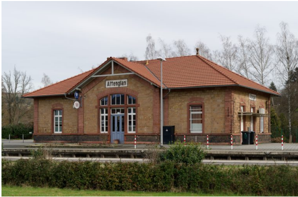
Blick auf das ehemalige Empfangsgebäude vom gegenüberliegenden Bahnsteig (Markus Eberl, 2024)

Philipp Markgraf am 05.04.2024 um 12:02:00Uhr