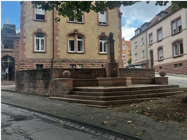
(Philipp Markgraf, 2024)