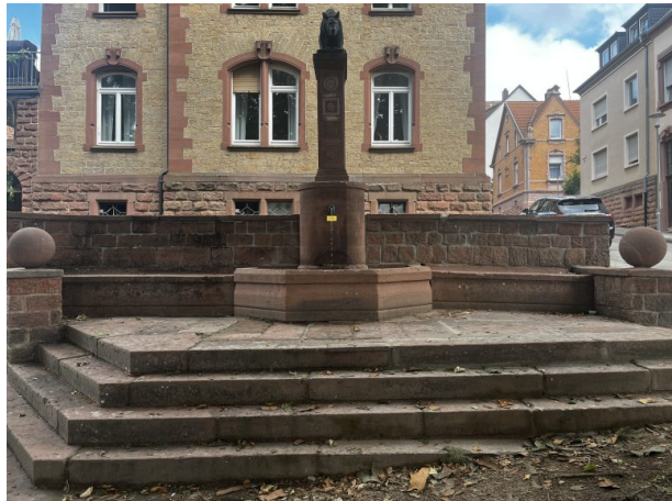
(Philipp Markgraf, 2024)