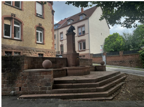
(Philipp Markgraf, 2024)