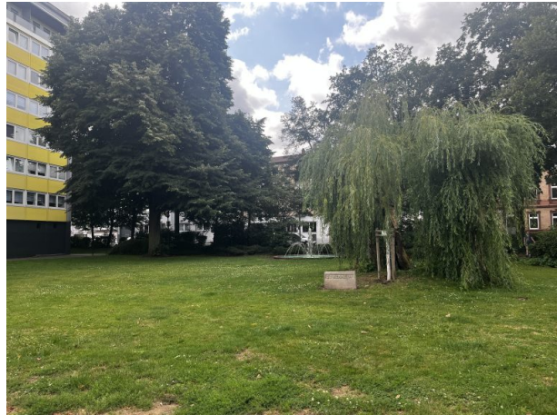
Brunnen am Ende des Kennedyplatzes (Philipp Markgraf, 2024)