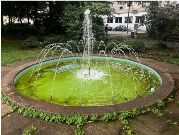
(Philipp Markgraf, 2024)

Philipp Markgraf am 06.08.2024 um 10:24:50Uhr