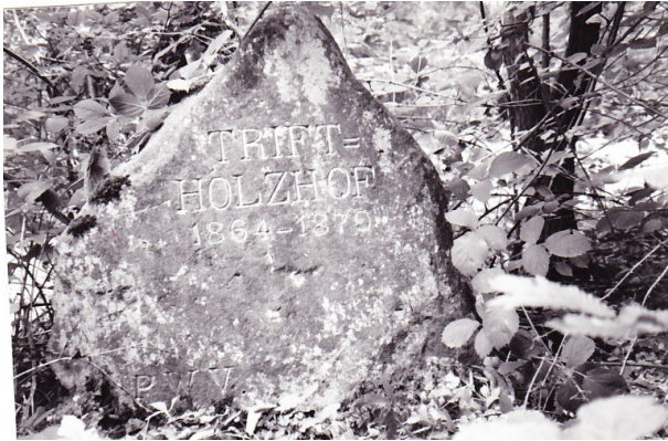
Ritterstein mit der Inschrift „Trift-Holzhof 1864 - 1879“