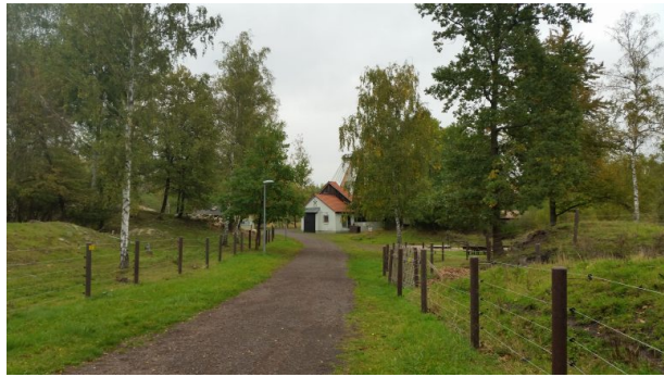
(Sonja Kasprick, 2017)