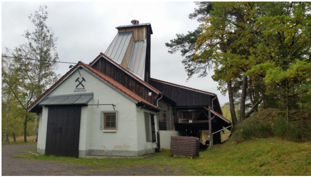
(Sonja Kasprick, 2017)