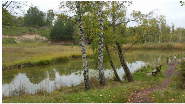
(Sonja Kasprick, 2017)