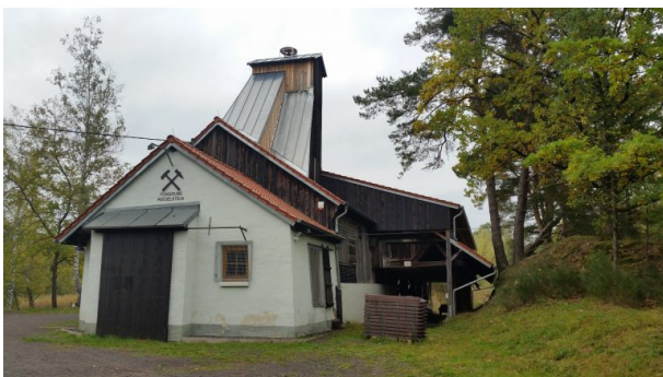
Ehemaliges Grubenhaus (Sonja Kasprick, 2017)