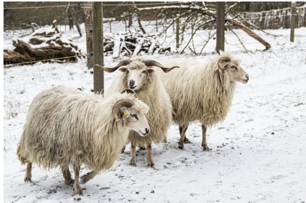
Heidschnucken in der Erdekaut (Adolf Beck, 2021)