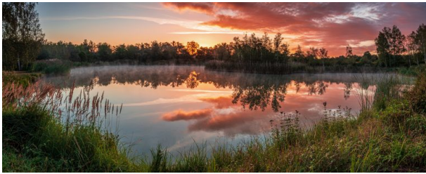
Erdekaut bei Dämmerung (Harald Kröher, 2020)