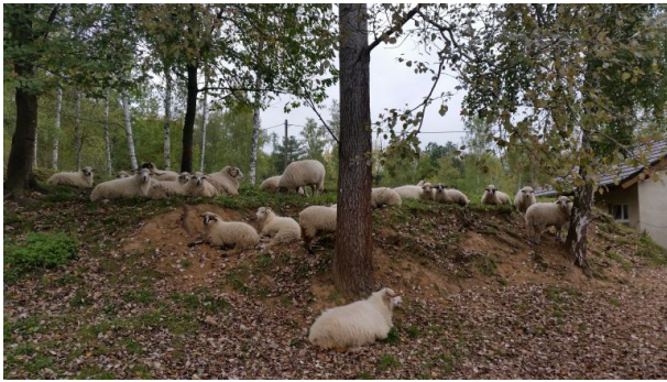
(Sonja Kasprick, 2017)