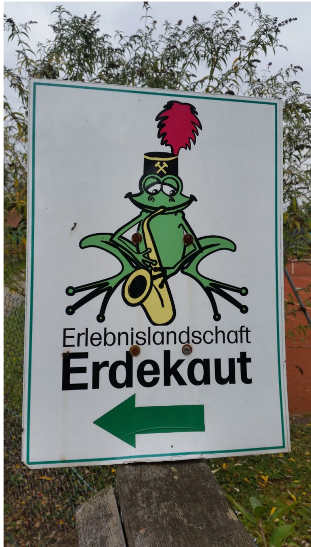
Hinweisschild (Sonja Kasprick, 2017)