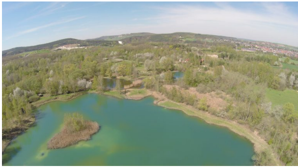
Luftaufnahme des Gebiets (Anna Wojtas, 2017)