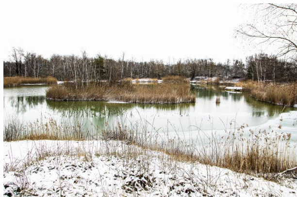
Erdekaut im Winter (Adolf Beck, 2021)