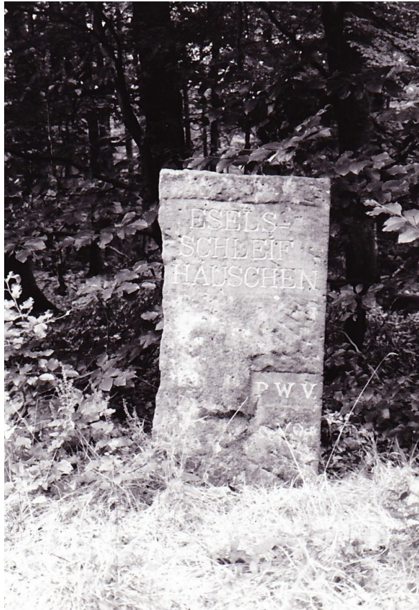
Ritterstein „Eselsschleif Häuschen“ (Ritterstein Nr. 5) (Erhard Rohe, 1993)

Sonja Kasprick am 18.10.2018 um 13:45:27Uhr