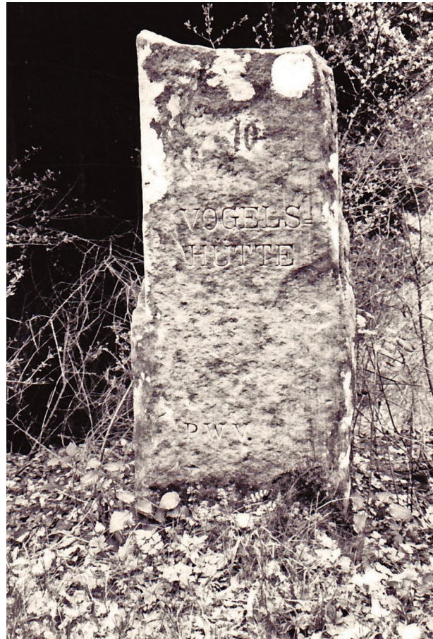
Ritterstein „Vogelshütte“ (Ritterstein Nr. 38) im hinteren Zieglertal bei Hinterweidenthal (Erhard Rohe, 1993)