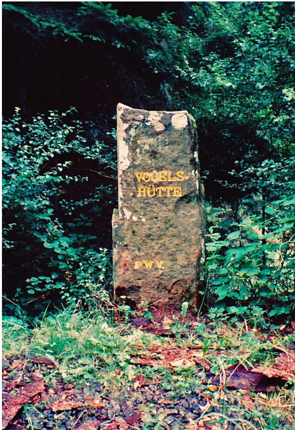
Ritterstein „Vogelshütte“ (Ritterstein Nr. 38) im hinteren Zieglertal bei Hinterweidenthal (Erhard Rohe, 1994)