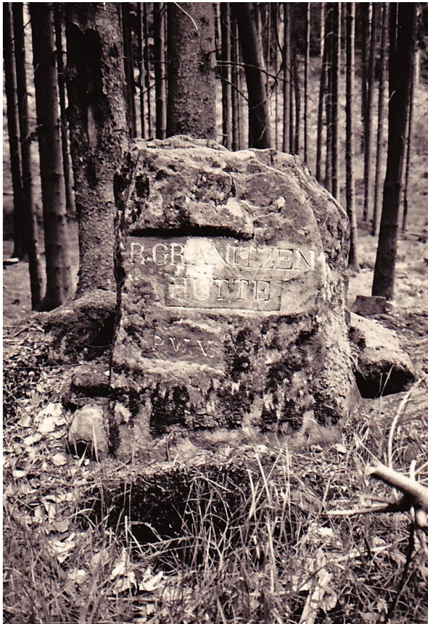
Ritterstein „R. Granitzenhütte“ (Ritterstein Nr. 40) im Horbachtal westlich der Einmündung des Mautzenbaches in den Horbach. (Erhard Rohe, 1993)