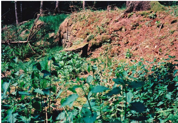
Ritterstein „R. Granitzenhütte“ (Ritterstein Nr. 40) im Horbachtal westlich der Einmündung des Mautzenbaches in den Horbach. (Erhard Rohe, 1997)