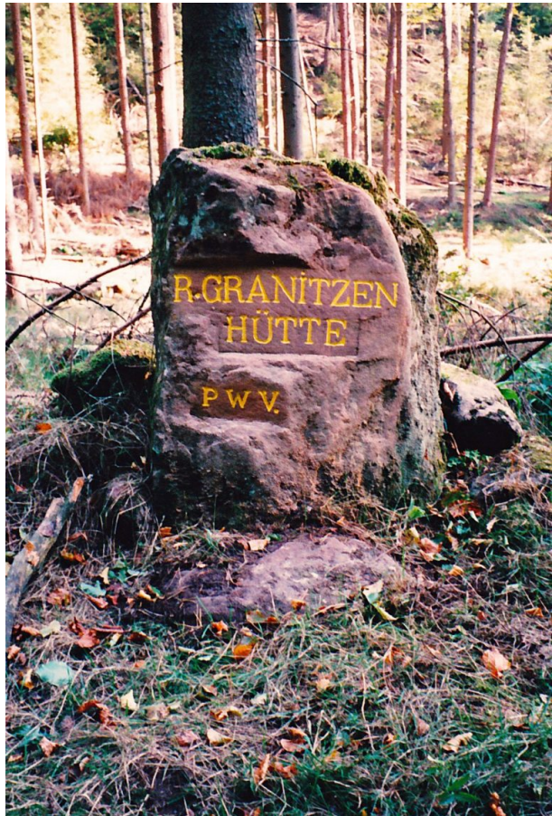
Ritterstein „R. Granitzenhütte“ (Ritterstein Nr. 40) im Horbachtal westlich der Einmündung des Mautzenbaches in den Horbach. (Erhard Rohe, 1999)