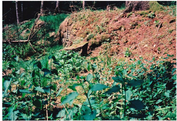
Ritterstein „R. Granitzenhütte“ (Ritterstein Nr. 40) im Horbachtal westlich der Einmündung des Mautzenbaches in den Horbach. (Erhard Rohe, 1997)