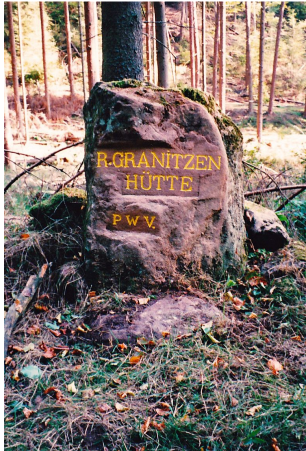
Ritterstein „R. Granitzenhütte“ (Ritterstein Nr. 40) im Horbachtal westlich der Einmündung des Mautzenbaches in den Horbach. (Erhard Rohe, 1999)