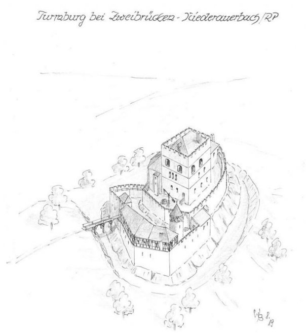
Rekonstruktionszeichnung der Turmburg von Wolfgang Braun (Wolfgang Braun)