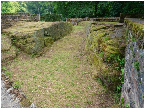
Von Nord nach Süd verlaufender Graben durch die Ruine der Ehrwoogburg in Zweibrücken. (Matthias Dreyer, 2018)