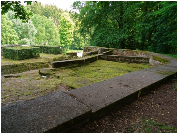
Blick über die Mauerreste der Ehrwoogburg in Zweibrücken in Richtung Süden. (Matthias Dreyer, 2018)