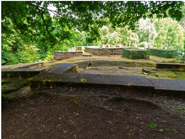
Blick über die Mauerreste der Ehrwoogburg in Zweibrücken in Richtung Südosten.