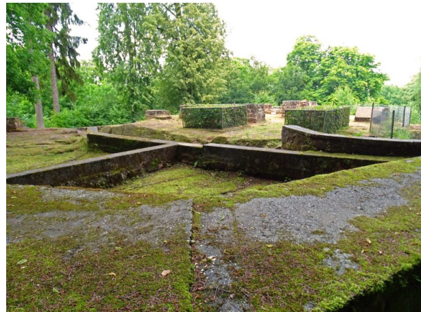
Blick über die Mauerreste der Ehrwoogburg in Zweibrücken in Richtung Norden. (Matthias Dreyer, 2018)