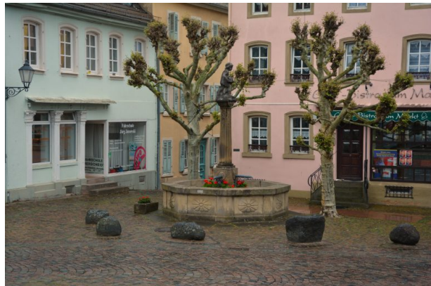
Hutmacherbrunnen in Kusel (Sonja Kasprick, 2019)