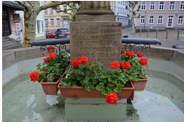
Inschrift auf dem Sockel des Hutmacherbrunnens in Kusel (Sonja Kasprick, 2019)