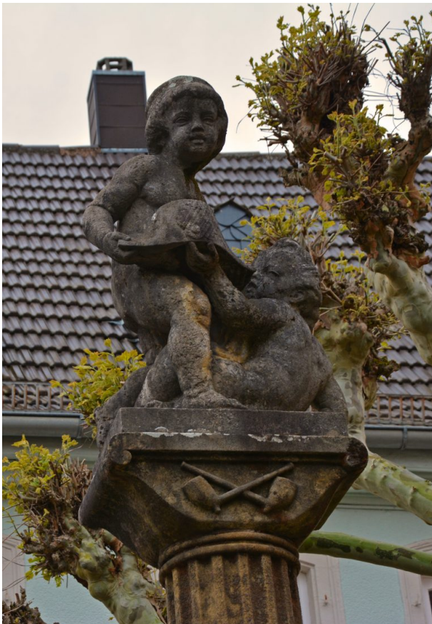
Figuren auf der Säule des Hutmacherbrunnens in Kusel. Zu sehen sind zwei spielende Kinder mit einem Schiffshut in den Händen (Sonja Kasprick, 2019)