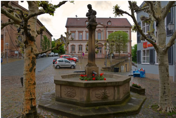
Hutmacherbrunnen am Marktplatz in Kusel. Im Hintergrund ist das Rathaus zu sehen (Sonja Kasprick, 2019)