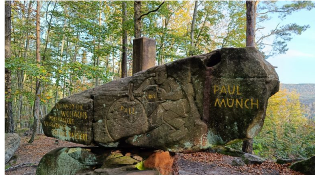
Der Name von Paul Münch und die Inschrift sind hier gut zu erkennen (Hans-Günther Clev, 2022)