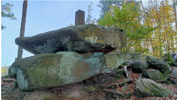
Das Datum 1964 ist in den Stein gemeißelt (Hans-Günther Clev, 2022)