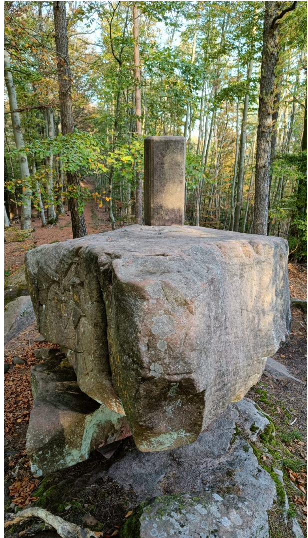
Seitliche Ansicht des Naturdenkmals (Hans-Günther Clev, 2022)