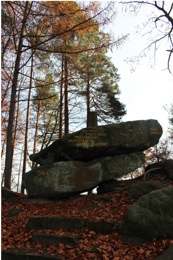
Weitere Ansicht auf die Weltachs (Arne Schwöbel, 2010)