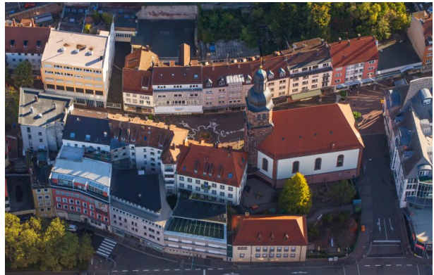
Luftaufnahme der Lutherkirche in Pirmasens (Harald Kröher, 2020)