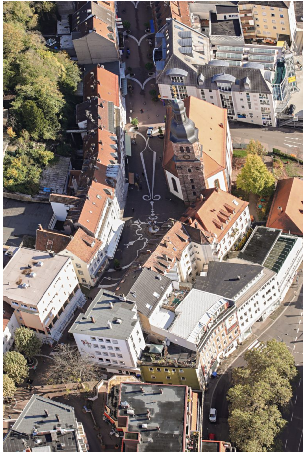
Luftaufnahme der Lutherkirche in Pirmasens (Harald Kröher, 2019)