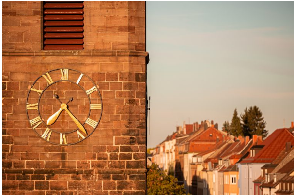
Kirchturmuhre der Lutherkirche in Pirmasens (Harald Kröher, 2020)