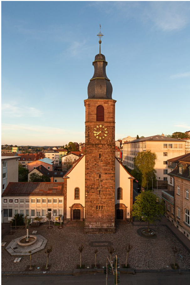
Frontansicht der Lutherkirche in Pirmasens (Harald Kröher, 2020)