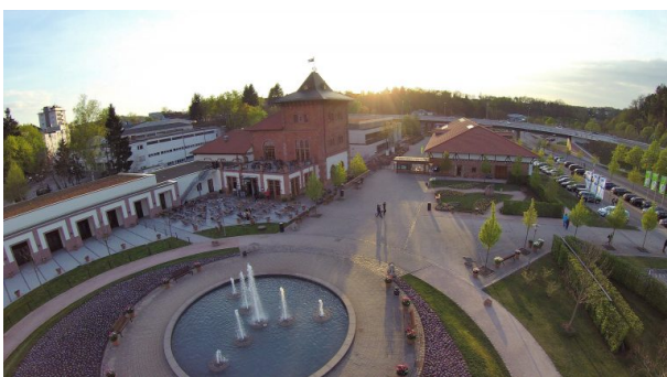
Luftaufnahme der Gartenschau Kaiserslautern mit Blick auf das Brauhaus (Anna Wojtas, 2014)