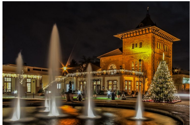
Gartenschau Kaiserslautern mit Blick auf das Brauhaus bei Nacht (Ralf Keller, 2014)