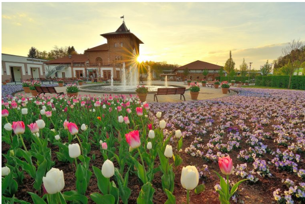
Gartenschau Kaiserslautern mit Blick auf das Brauhaus (Anna Wojtas, 2015)

Sonja Kasprick am 19.10.2018 um 20:35:08Uhr