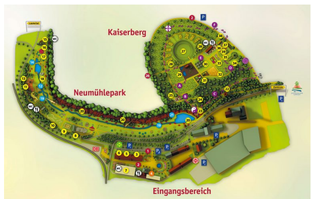
Geländeplan der Gartenschau Kaiserslautern