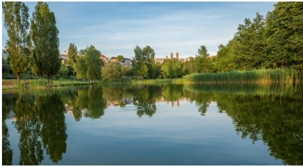
Blick über den See im Strecktalpark in Pirmasens. (Harald Kröher, 2017)