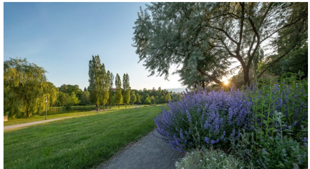
Blumenbeete am Wegesrand des Strecktalparks in Pirmasens. (Harald Kröher, 2017)