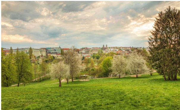
Strecktalpark in Pirmasens (Harald Kröher, 2020)