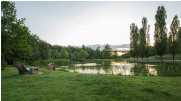
See im Strecktalpark in Pirmasens. (Harald Kröher, 2017)