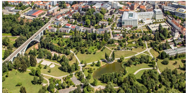
Luftaufnahme des Strecktalparks innerhalb von Pirmasens.