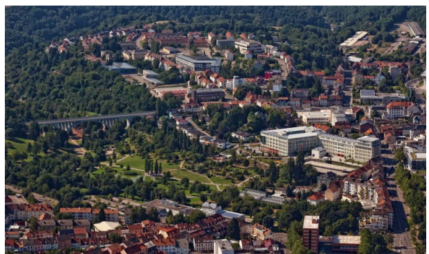
Luftaufnahme des Strecktalparks in Pirmasens. (Harald Kröher, 2016)