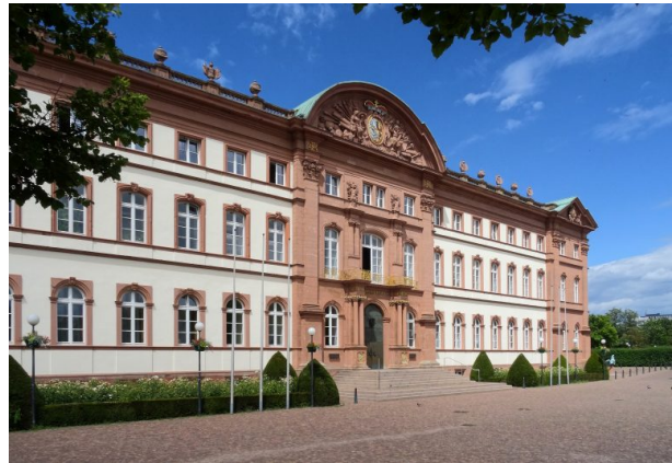
Blick auf die nach Süden ausgerichtete Hoffassade des Zweibrücker Schlosses. Zu sehen sind die vertikale und horizontale Fassadengliederung, die große Freitreppe, der dekorierte Segmentgiebel, sowie die Balustarde vor dem flachen Dach. (Christian Weidler, 2015)