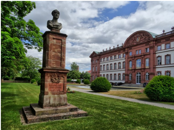
Blick in den Zweibrücker Schlossgarten. Im Vordergrund steht das Denkmal König Maximilians I. Joseph. (Christian Weidler, 2015)