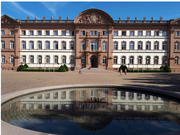
Schloss in Zweibrücken. Im Vordergrund der Brunnen auf dem Schlossplatz (Dr. Hans-Günther Clev, 2018)