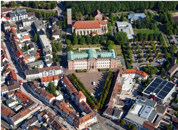
Luftaufnahme des Zweibrücker Schlosses mit vorgelagertem Schlossplatz von Süden. Im Hintergrund ist die Heilig-Kreuz-Kirche zu sehen. Am oberen Bildrand verläuft der Schwarzbach mit beidseitiger Baumallee. (Harald Kröher, 2014)