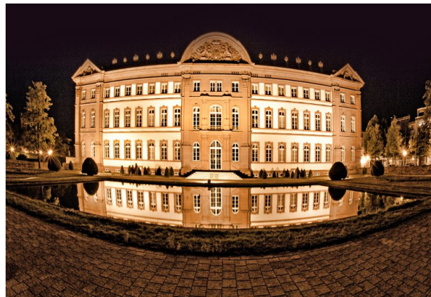
Das beleuchtete Schloss in Zweibrücken bei Nacht von der nördlichen Gartenseite. (Harald Kröher, 2015)