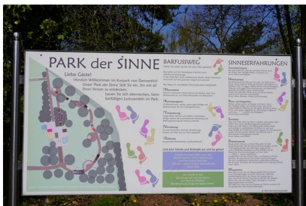
Informationstafel über den Park der Sinne in Dannenfels (Dana Taylor , 2020)

Andrea Melzer am 19.10.2018 um 20:35:34Uhr