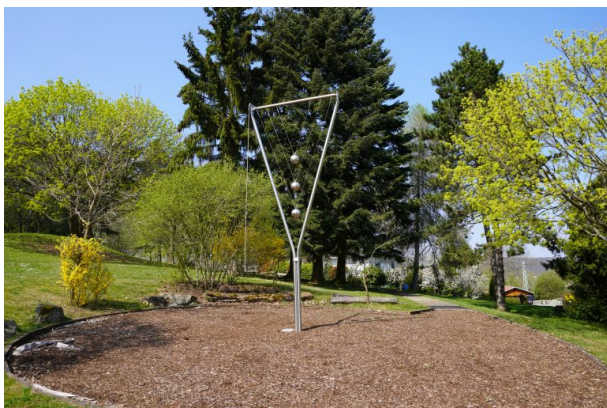
Dreizeitenpendel im Park der Sinne (Dana Taylor , 2020)