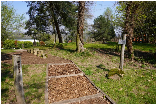
Barfußpfad im Park der Sinne (Dana Taylor , 2020)