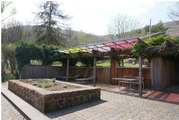
Klimapavillion mit bunter Überdachung im Park der Sinne (Dana Taylor , 2020)