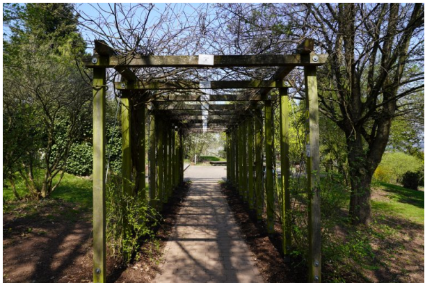
Jahreszeitenpergola im Park der Sinne (Dana Taylor , 2020)