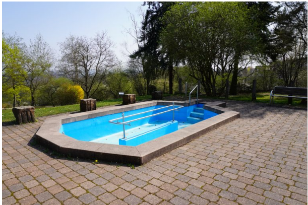
Kneippbecken im Park der Sinne (Dana Taylor , 2020)