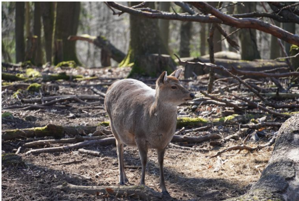
Reh im Wildpark und Greifvogelzoo Potzberg (Dana Taylor, 2021)