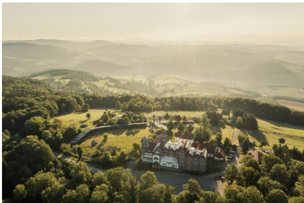
Blick über den Wildpark und Greifvogelzoo Potzberg (Michael Rübél, 2021)

Andrea Melzer am 19.10.2018 um 20:39:50Uhr