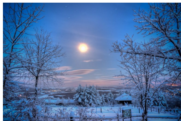
Blick vom Potzberg über den Wildpark und Greifvogelzoo Potzberg in östliche Richtung. (Michael Rübel, 2015)