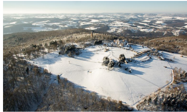
Luftaufnahme des Wildparks und Greifvogelzoos Potzberg. Im Hintergrund kann man den benachbarten Potzbergturm erkennen. (Harald Kröher, 2014)