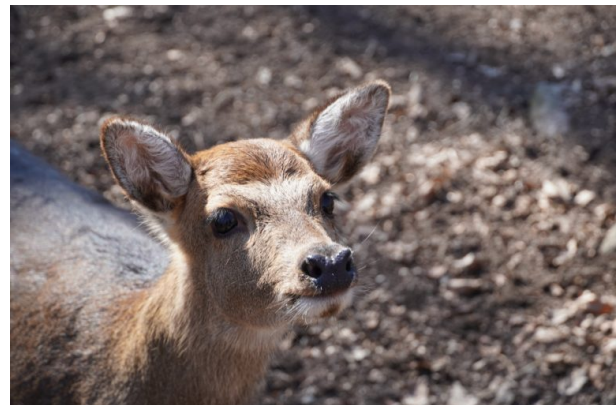
Reh im Wildpark und Greifvogelzoo Potzberg (Dana Taylor, 2021)