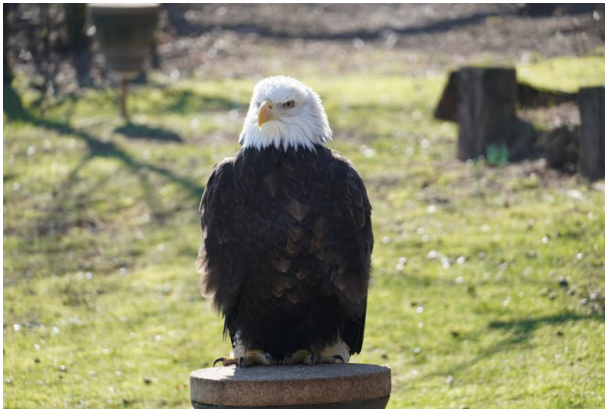
Weißkopfseeadler im Wildpark und Greifvogelzoo Potzberg (Dana Taylor, 2021)