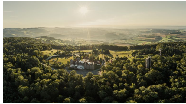
Panorama über den Wildpark Potzberg (Michael Rübel, 2021)