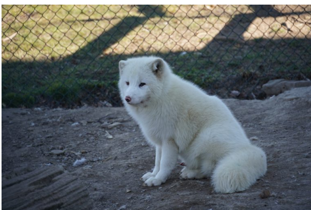
Polarfuchs im Wildpark und Greifvogelzoo Potzberg (Dana Taylor, 2021)