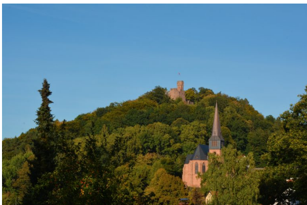
Westansicht der Rochuskirche in Kaiserslautern Hohenecken. Im Hintergrund die Ruine der Burg Hohenecken auf dem Schlossberg. (Dr. Hans-Günther Clev, 2018)