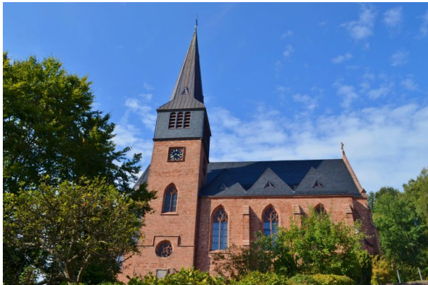
Südansicht der Rochuskirche in Kaiserslautern Hohenecken. (Dr. Hans-Günther Clev, 2018)

Raphaela Maertens am 20.03.2019 um 09:50:08Uhr