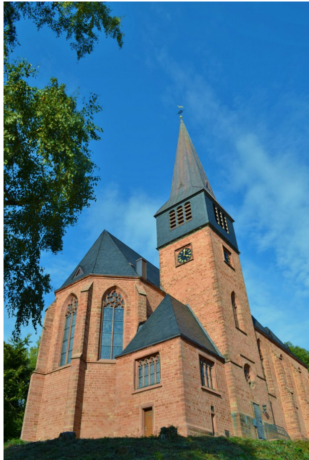
Westansicht der Rochuskirche in Kaiserslautern Hohenecken.