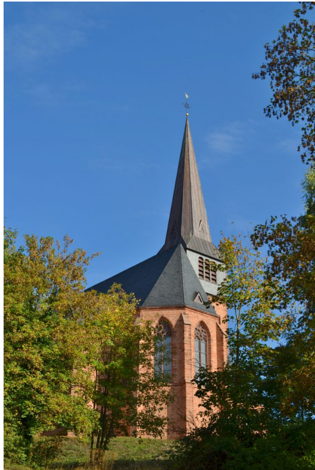
Westansicht der Rochuskirche in Kaiserslautern Hohenecken.