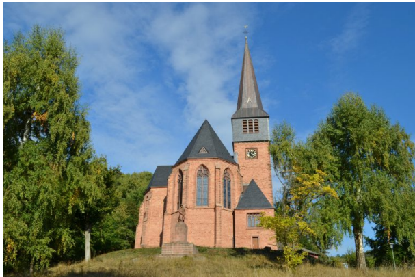
Westansicht der Rochuskirche in Kaiserslautern Hohenecken.