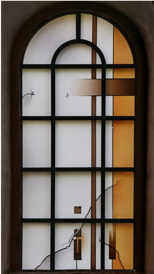
Nordfenster (Andreas Rummel, 2017)