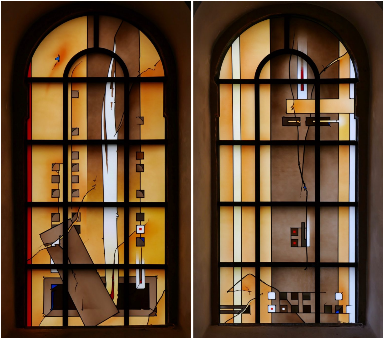
Auferstehungsfenster (Andreas Rummel, 2017)