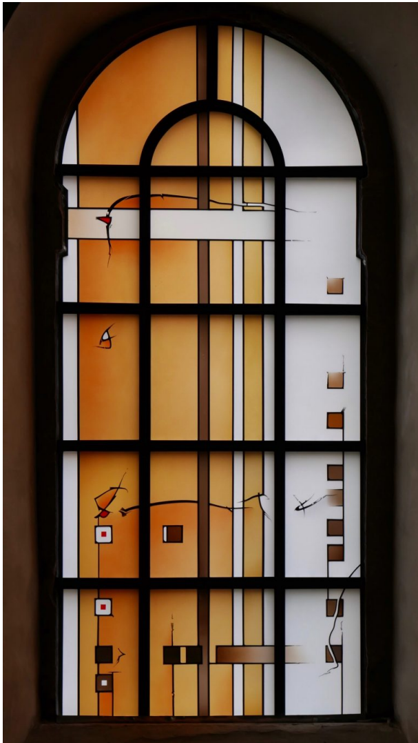
Missionsfenster (Andreas Rummel, 2017)